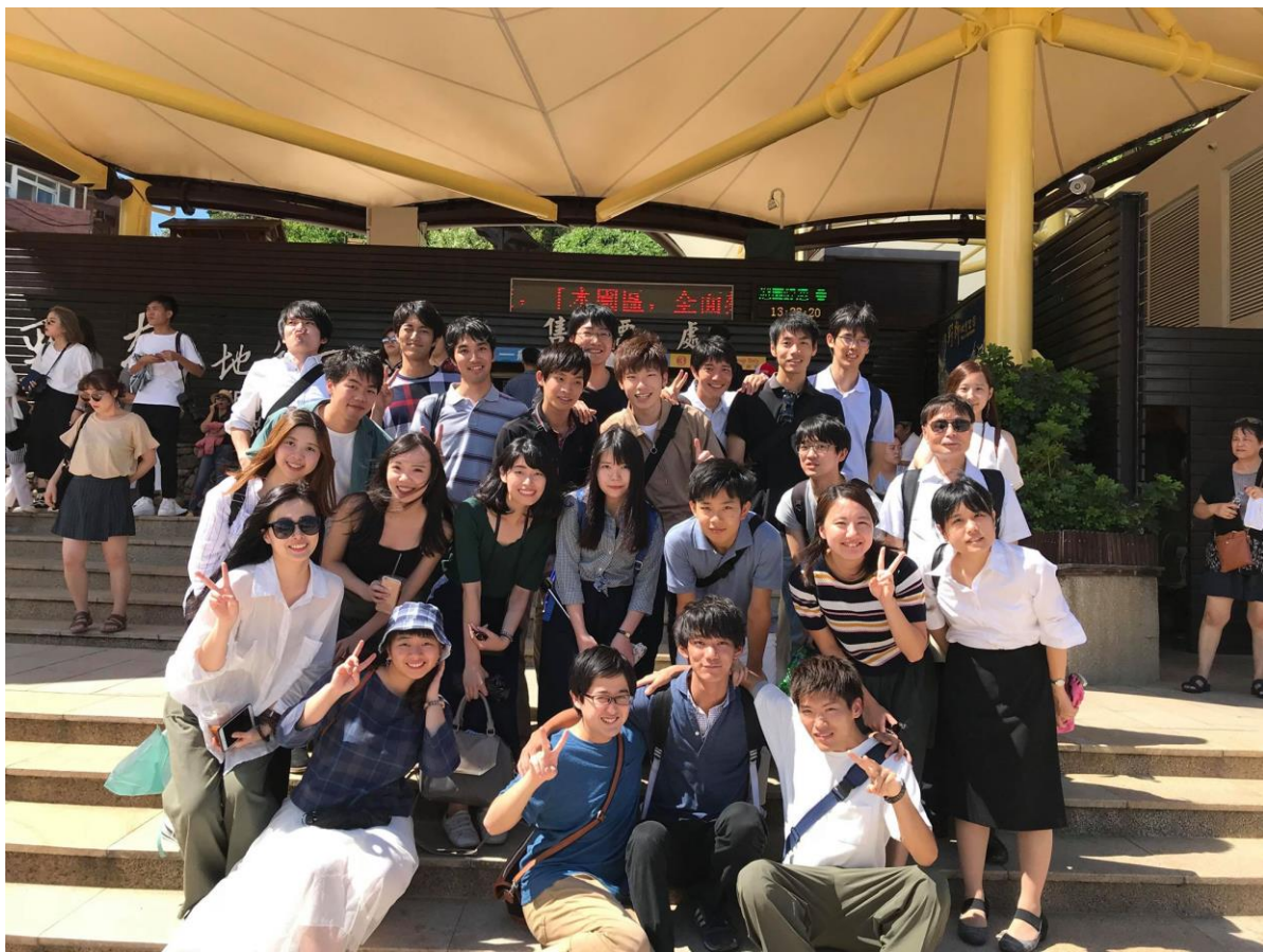
日本東京大學師生來訪, 09/2018