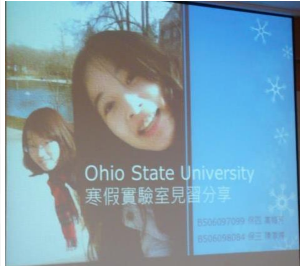
The Ohio State University, 02/2012