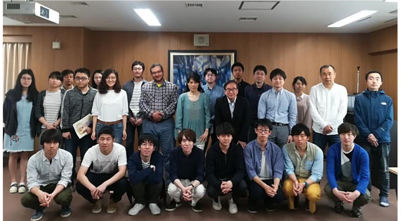
Hokkaido University, 08/2018