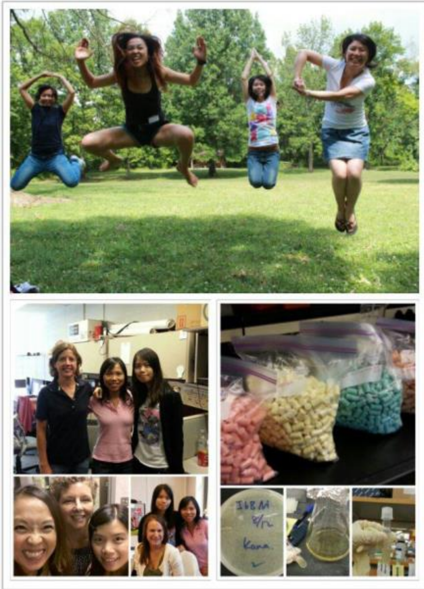
The Ohio State University, 07/~08/2012