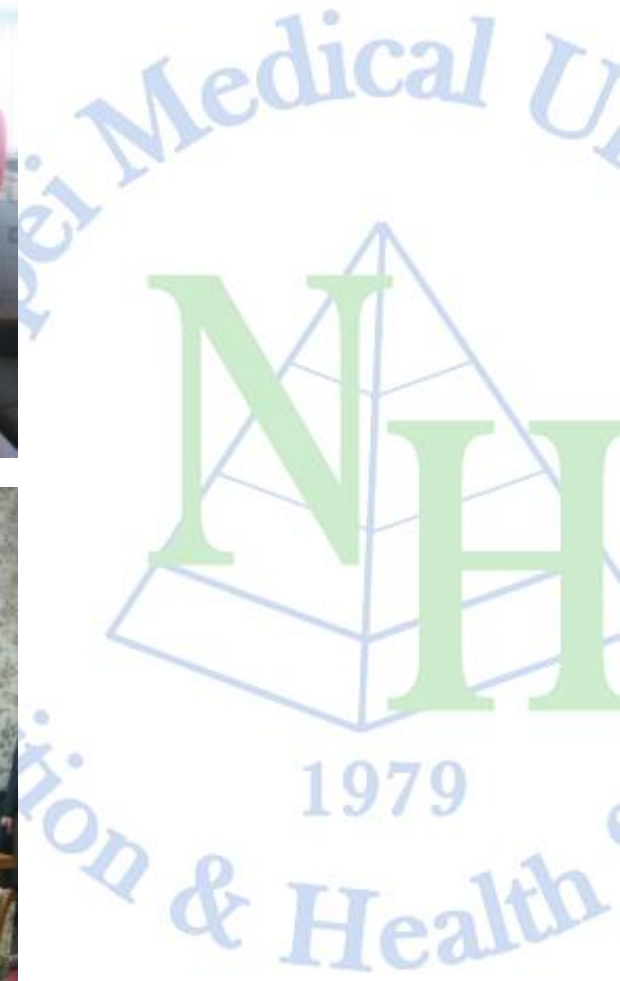
101.07參訪日本帝國大學