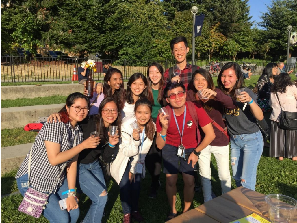
The University of British Columbia, 08/2018