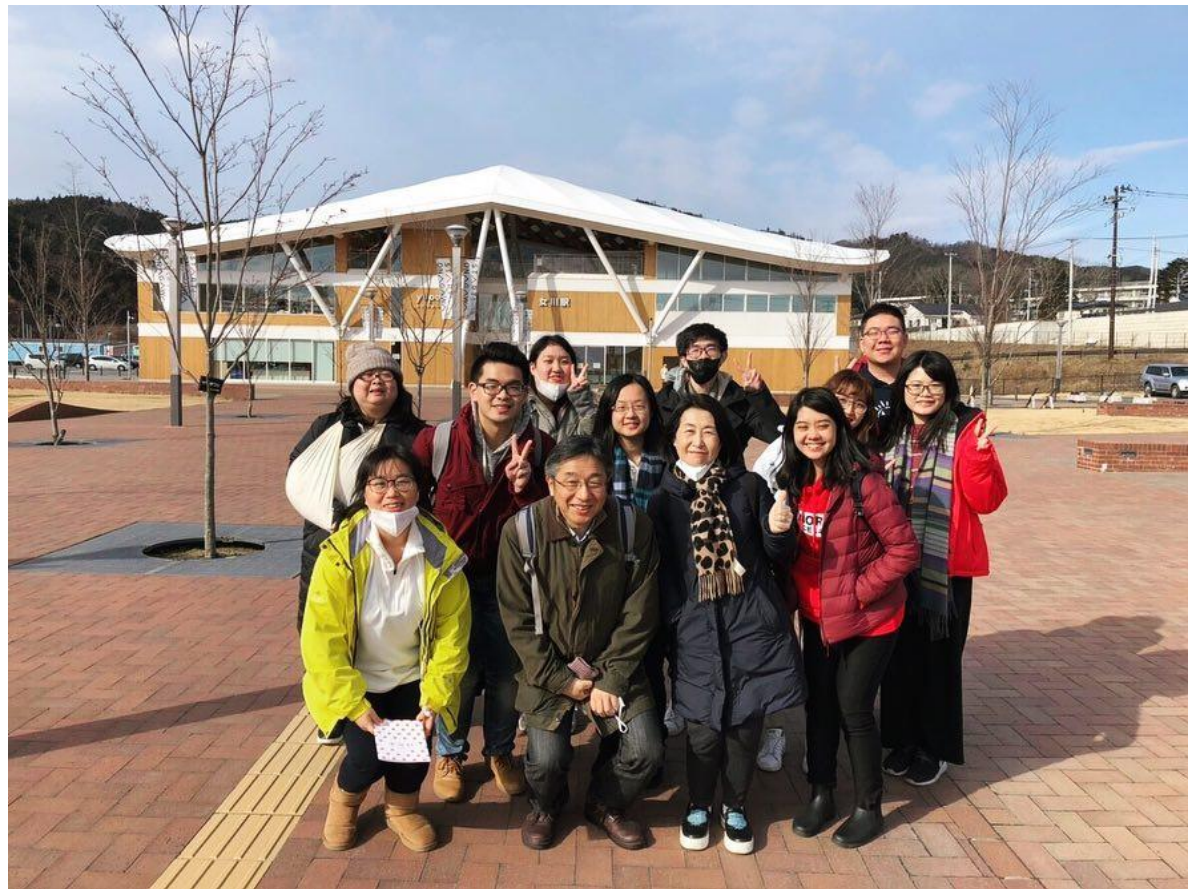
Sakura Tech Project, 02/2019