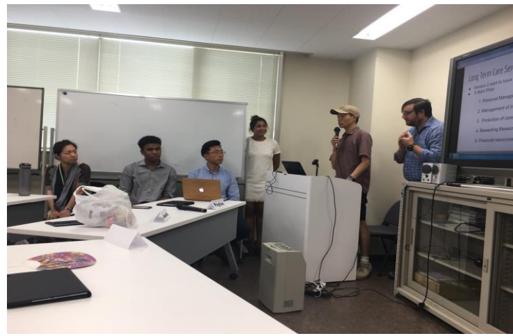
Teikyo University Summer School, 08/2018